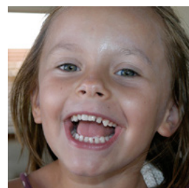
Dates d'éruption des dents de lait